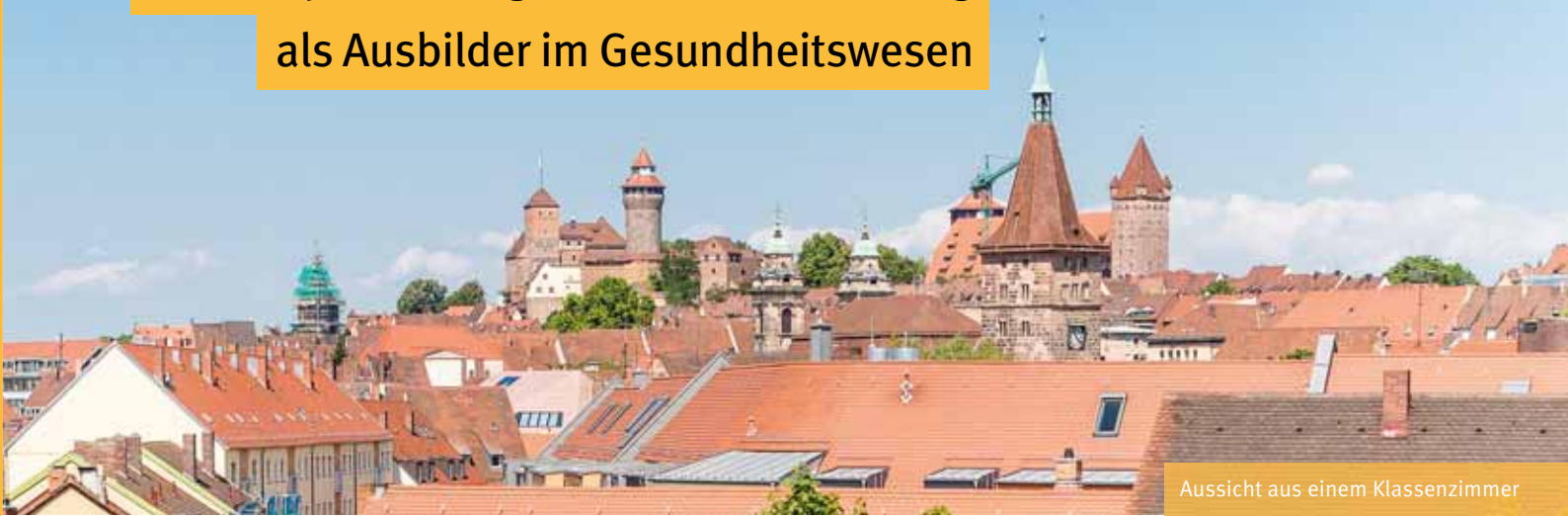
Aussicht aus einem Klassenzimmer