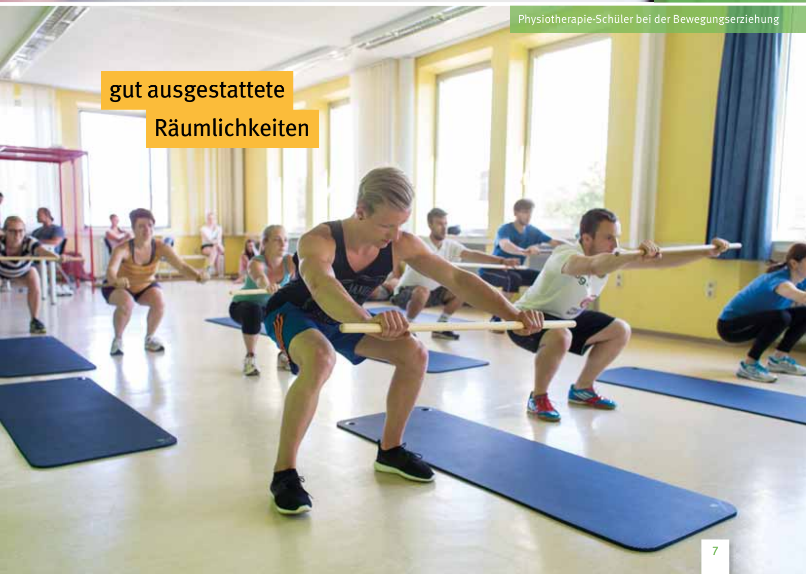
Physiotherapie-Schüler bei der Bewegungserziehung